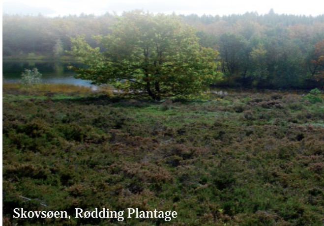
Skovsøen, Rødding Plantage

Enkelte steder, hovedsageligt i byerne, er opsat højthængende skilte i rutens farve og med sort pil.